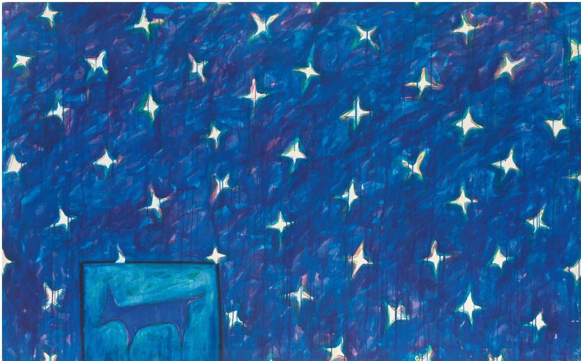
Animal solitario de la noche cegada por el alba, 1983. Acrílico sobre lienzo. Galería de Arte Magda Lázaro.

Con esta producción retrospectiva, el CAAM rinde homenaje a la figura y la obra de un artista apenas conocido por el público general, en el contexto de su línea de trabajo e investigación en torno a la creación contemporánea en Canarias. Es una muestra que pretende rescatar del olvido y poner en valor para futuras generaciones el legado de un artista que ha permanecido tres décadas en el olvido y sobre el que destacadas voces de la Cultura refrendan su singular y extraordinaria trayectoria artística.