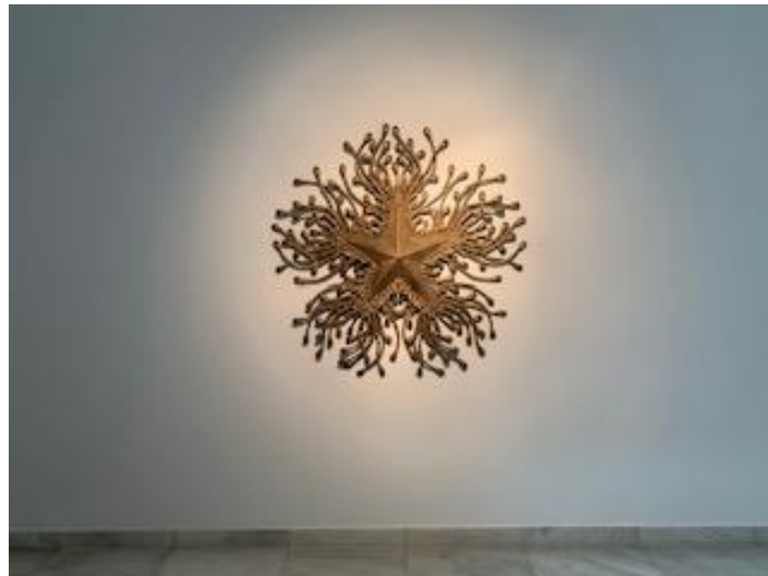
Dagoberto Rodríguez 'No Estrella Astrophyton Muricatum' 2019. Bronze