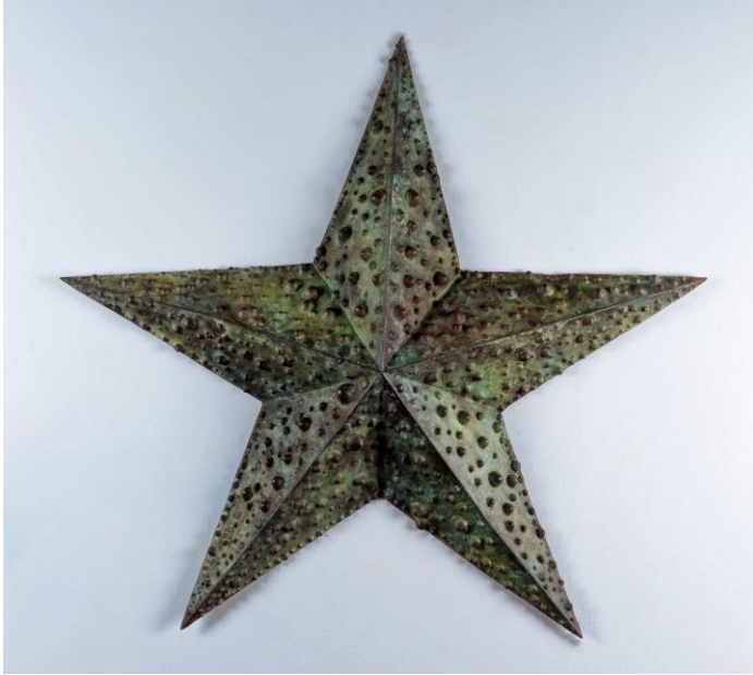
Dagoberto Rodríguez, No Estrella Oreaster , 2019. Bronze