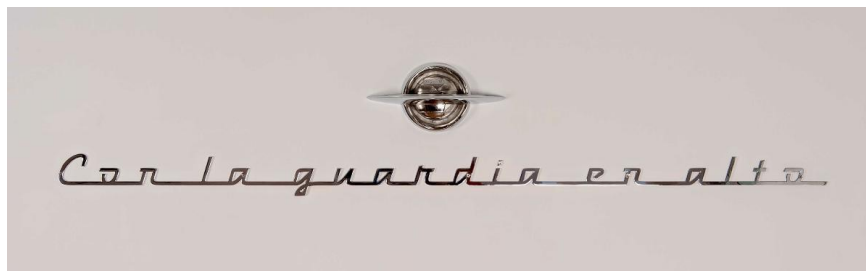
Dagoberto Rodríguez, Con la guardia en alto , 2019. Bronce cromado