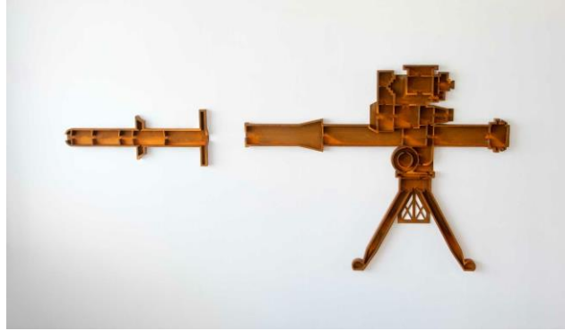
Dagoberto Rodríguez, Casa Tow , 2018. Acero cortén