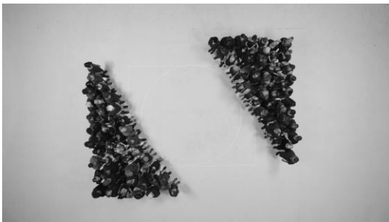
Dagoberto Rodríguez, Geometría popular , 2020. Vídeo