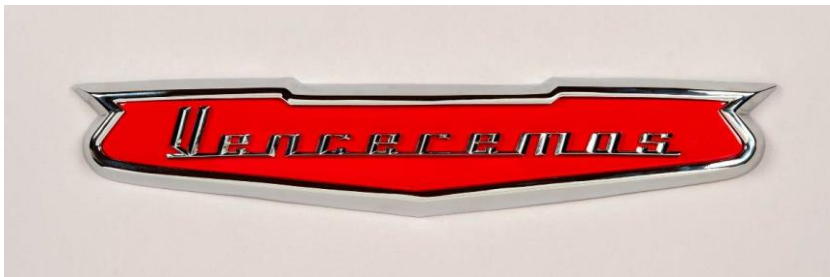
Dagoberto Rodríguez, Venceremos , 2019. Bronce cromado