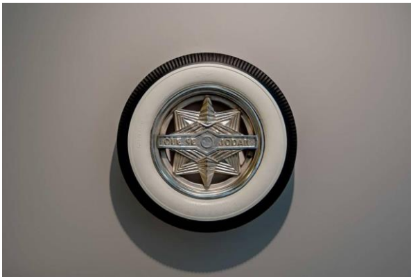
Dagoberto Rodríguez, Qué se jodan , 2019. Bronce cromado y neumático