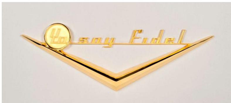
Dagoberto Rodríguez, Yo soy Fidel , 2018. Bronce cromado