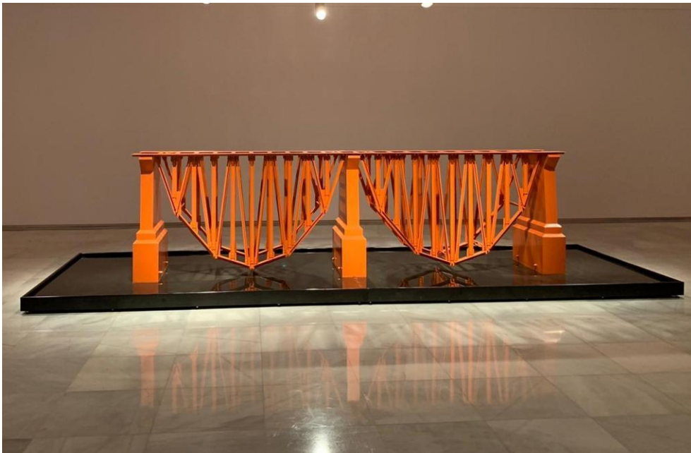
Dagoberto Rodríguez, Puente invertido doble , 2019. Acero