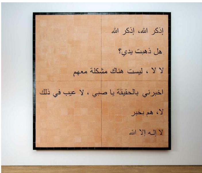
Dagoberto Rodríguez, Tweet , 2018. Cerámica