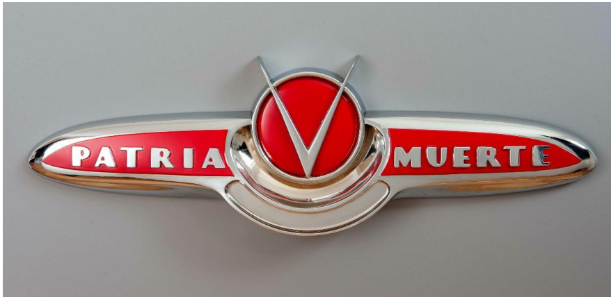
Dagoberto Rodríguez. Patria o Muerte , 2018. Bronce cromado