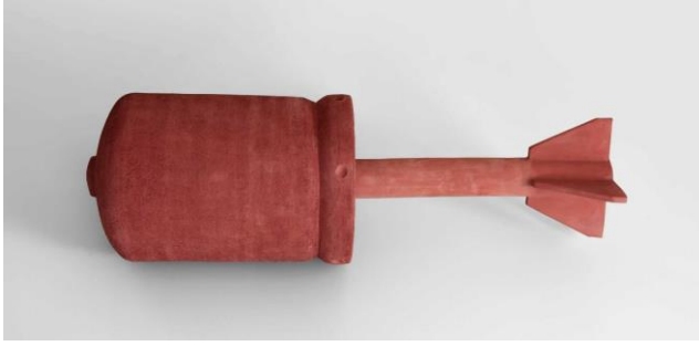
Dagoberto Rodríguez, Ánforas , 2020. Barro cocido (20 unidades)